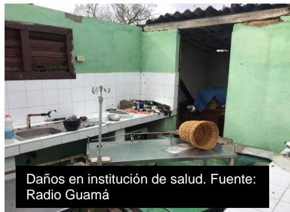
Daños en institución de salud.